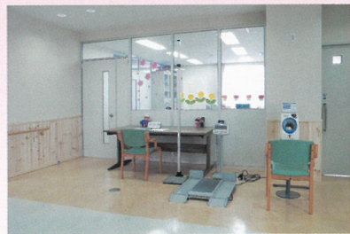
ヘルパーステーション ▶