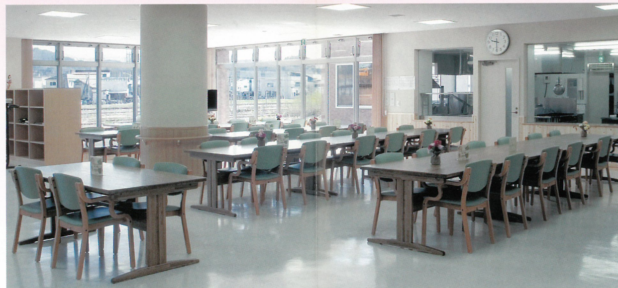
▲ 食堂1F地域交流ホール