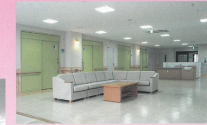
▲ 特室施設ユニット