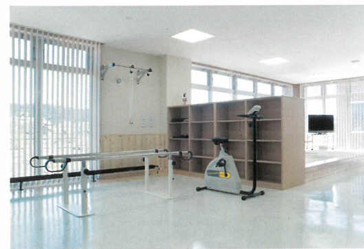
▶ 機能訓練スペース